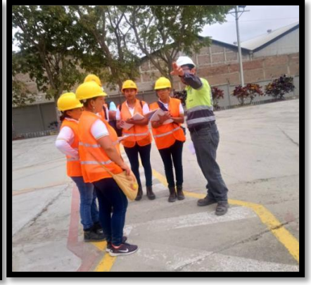
Incorporación de jóvenes en las figuras profesional de Asistente técnico en Obra Civil, Seguridad Industrial y Gestor Especialista en Ventas.